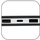
2 puertos USB y 1 puerto tipo C.