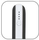
Indicador de cargar.