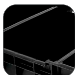
Separadores móviles. (CPS9)