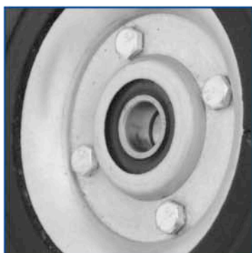
Rin de lámina.