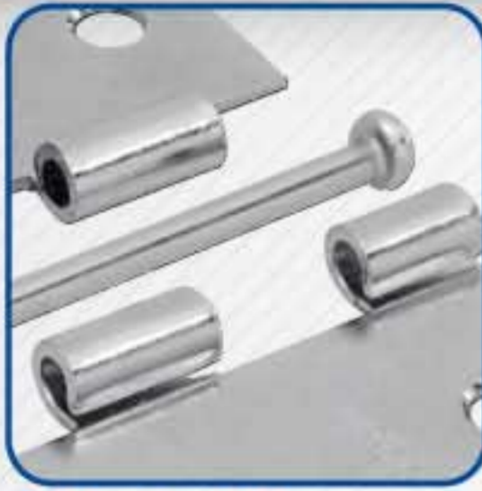
• Perno suelto.