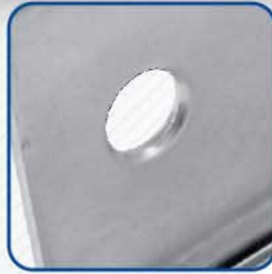
• 6 agujeros avellanados para usar tornillo con cabeza plana.