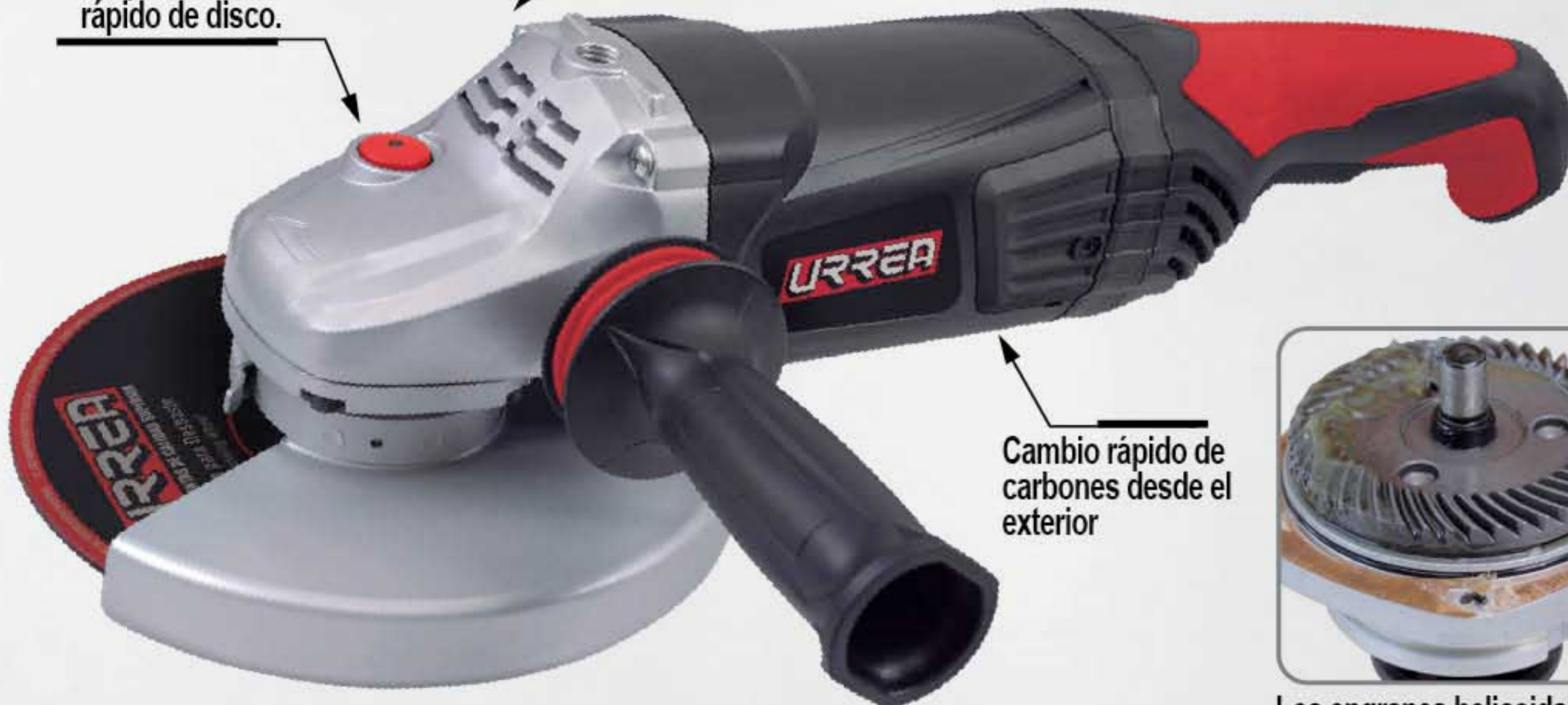
Cambio rápido de carbones desde el exterior