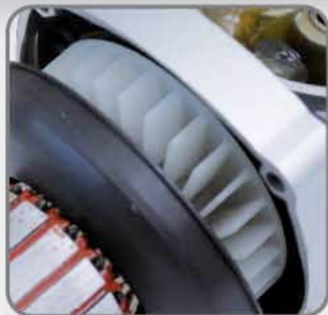
Cubierta que protege de polvo y partículas de metal al motor.