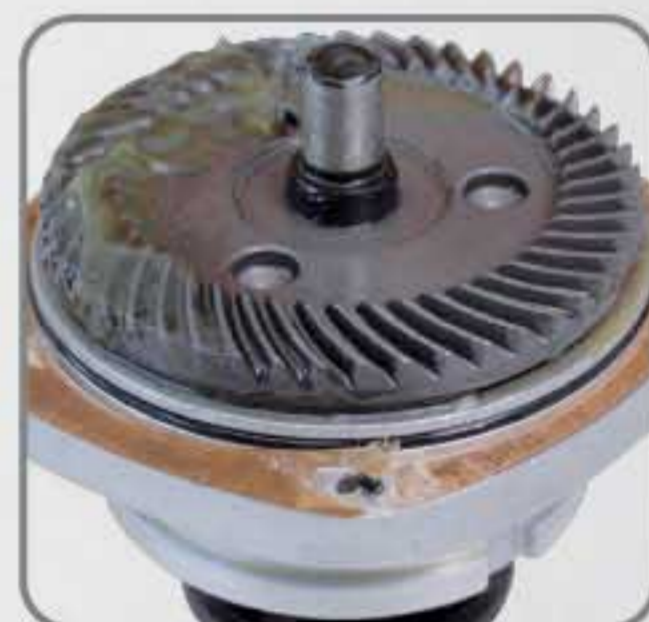
Los engranes helicoidales tienen la ventaja de transmitir más potencia que los rectos, dan mayor velocidad, son más silenciosos y de mayor duración.