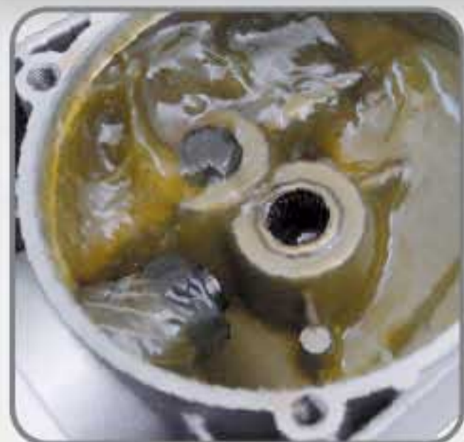
Grasa de litio y baleros.