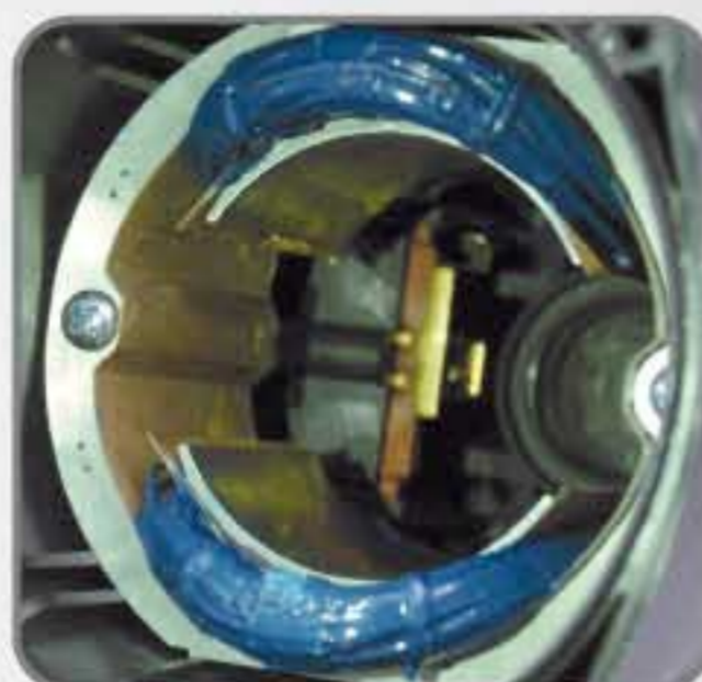
Aislamiento Epóxico reduce el calentamiento y protege al motor contra las partículas de metal y abrasivos arrastrados por la corriente de aire de la ventilación.