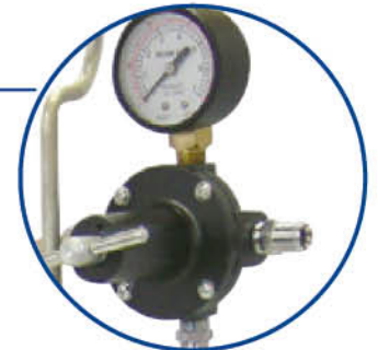
Regulador de aire, válvula de seguridad y manómetro.