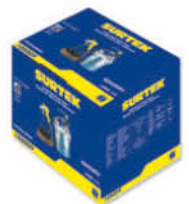
3.6 m de manguera para fluido.