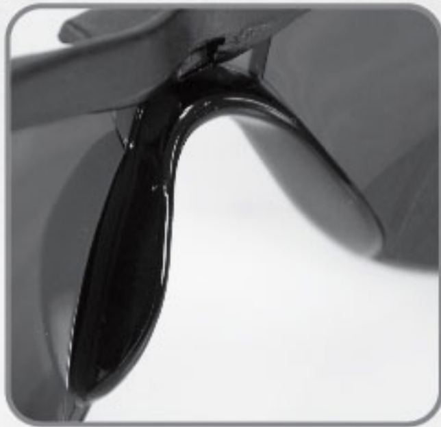
Soporte de Nariz de hule suave anti-derrapante.