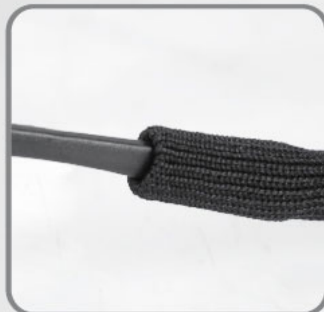
Correa de nylon ajustable a las patas, con sistema para ajustar el largo necesario de la correa.