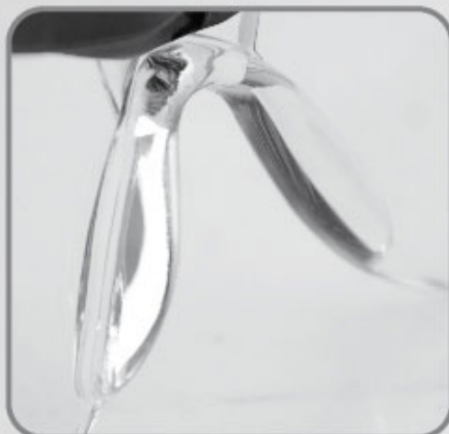
Soporte de Nariz de hule suave anti-derrapante.