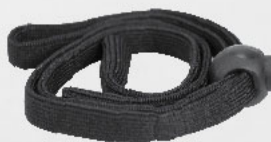
Incluye: correa de nylon

Mica de policarbonato inyectado, prismado para reflejar y refractar la luz con tratamiento anti-UV.