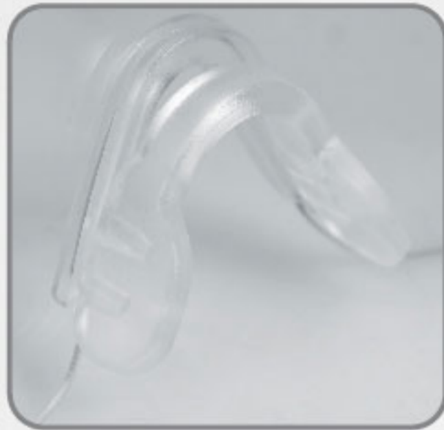
Soporte de Nariz de hule suave anti-derrapante.