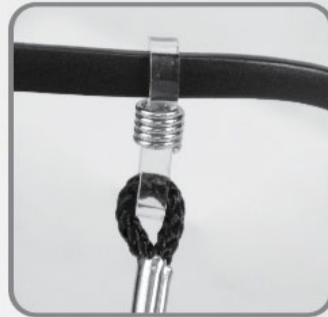
Cordón de nylon ajustable a las patas.