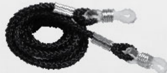
Incluye: cordón de nylon

Mica de policarbonato inyectado, prismado para reflejar y refractar la luz con tratamiento anti-UV.