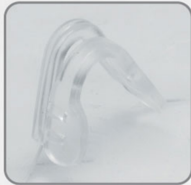
Soporte de Nariz de hule suave anti-derrapante.