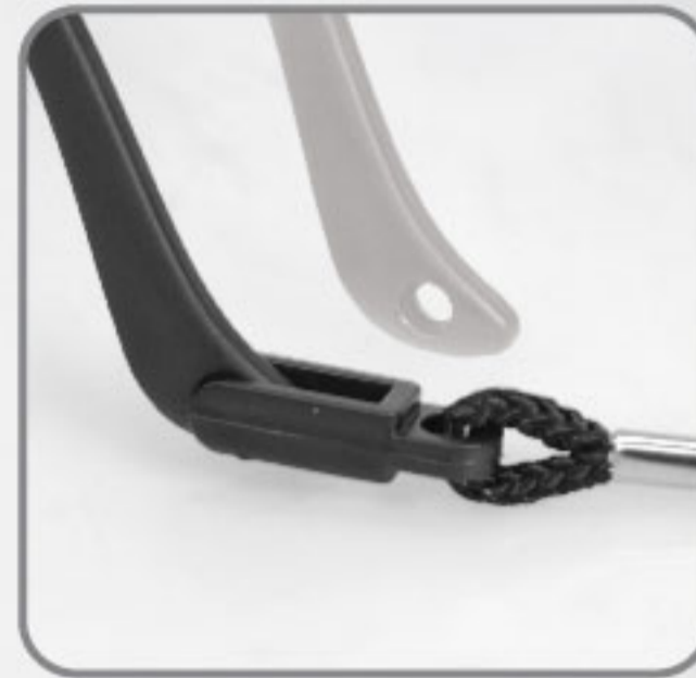
Cordón de nylon ajustable a las patas.