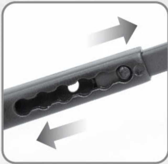
Patas de posiciones para mejor ajuste.