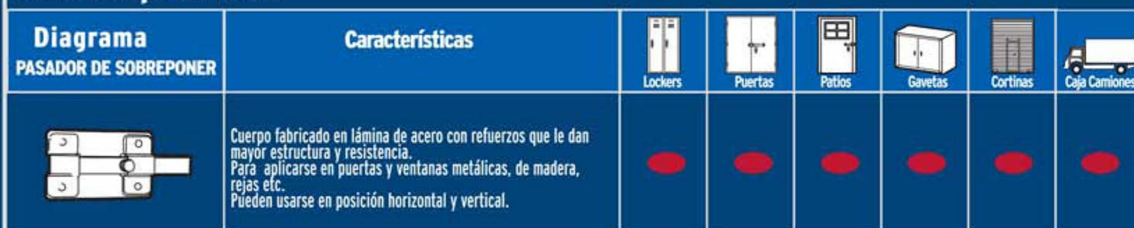
Tabla de aplicaciones