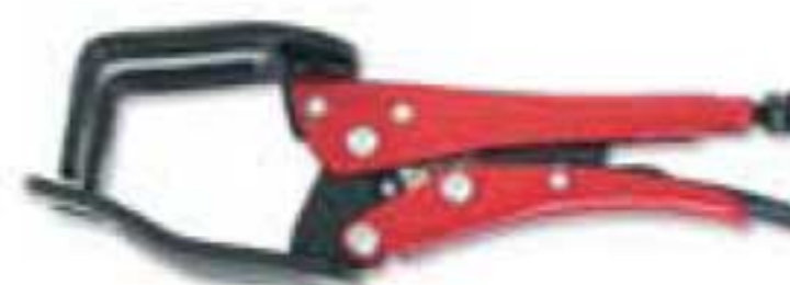
4129 9" Uso pesado