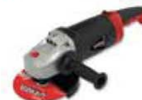
EA907A 7" de 2500W 8500 rpm