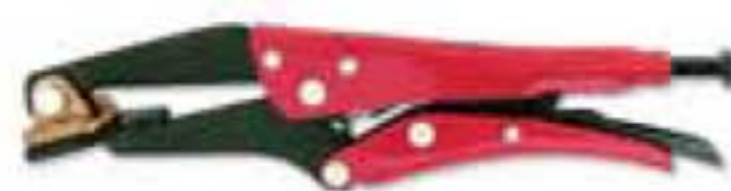
4137 9 1/2" Tapapuntos.