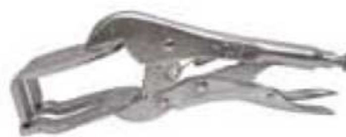
261R 9" Para soldar