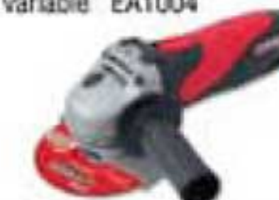
EA1004 4 1/2" de 1100W 3000-10000 rpm EA904 4 1/2" de 900W 11000 rpm