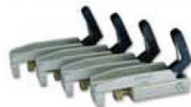
4140 3 5/8" Juego de 4 microgrips