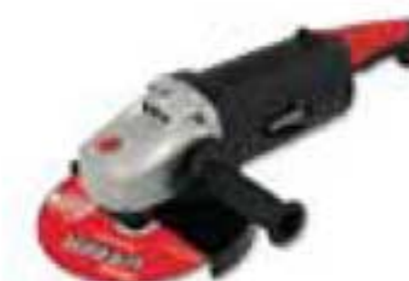
EA909A 9" de 2500W 6500 rpm