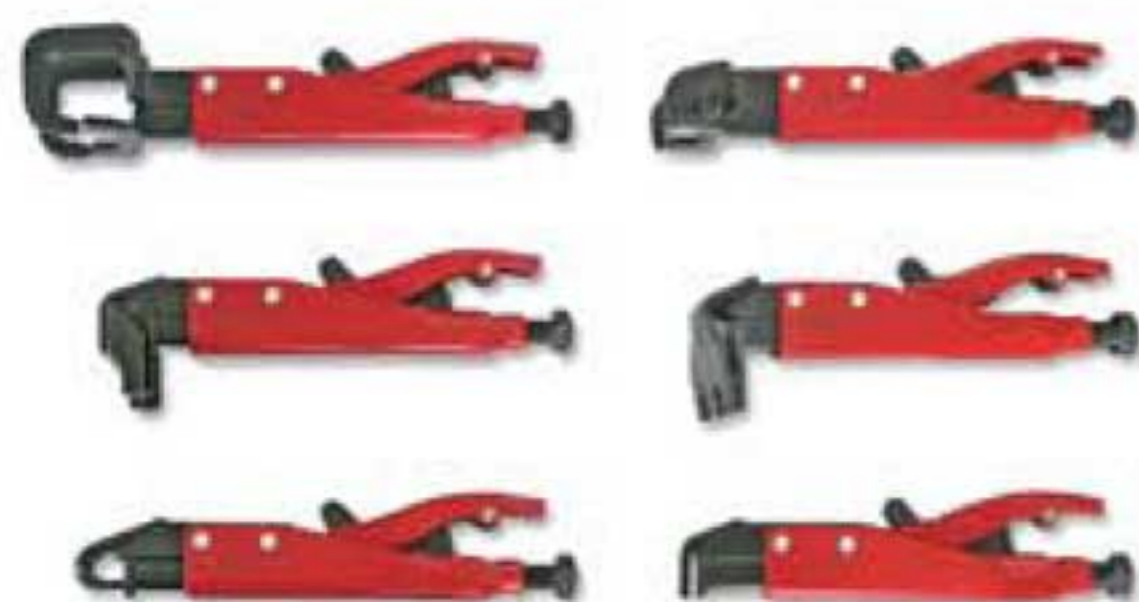
4179 Juego de pinzas de presión axiales.