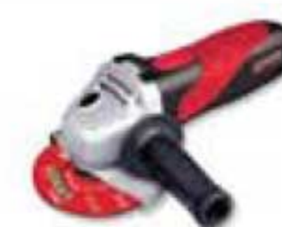
EA704A 4 1/2" de 900W 11000 rpm