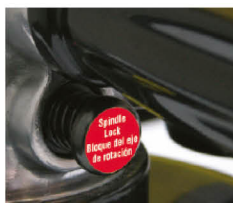
Traba de seguridad del eje para cambios rápidos de disco