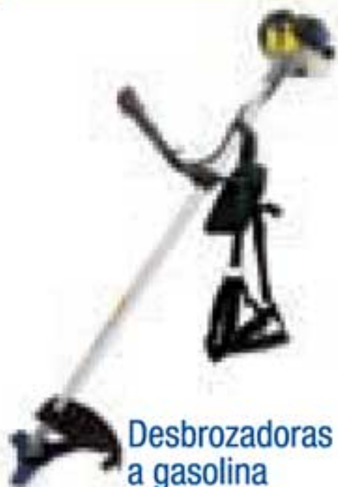
Desbrozadoras a gasolina