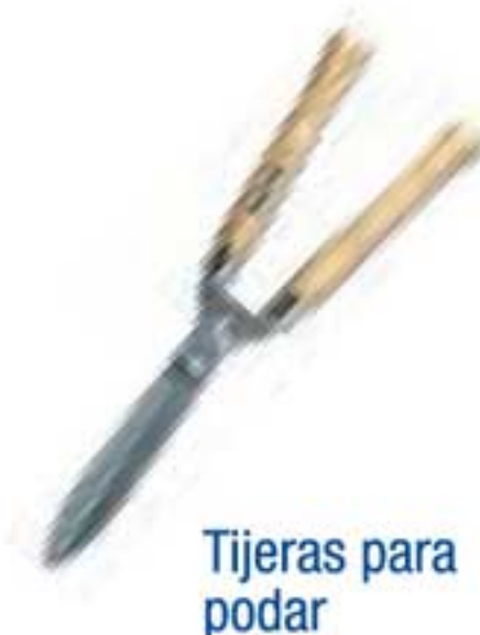
Tijeras para podar