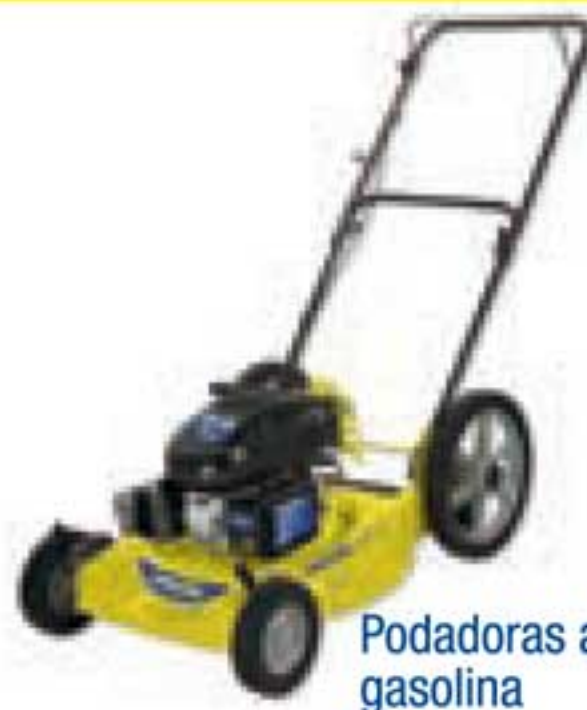
Podadoras a gasolina